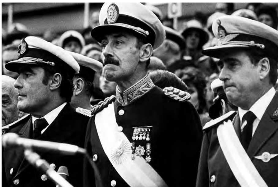
Videla, Massera and Agosti, members of the Military Junta that overthrew the constitutional government in 1976