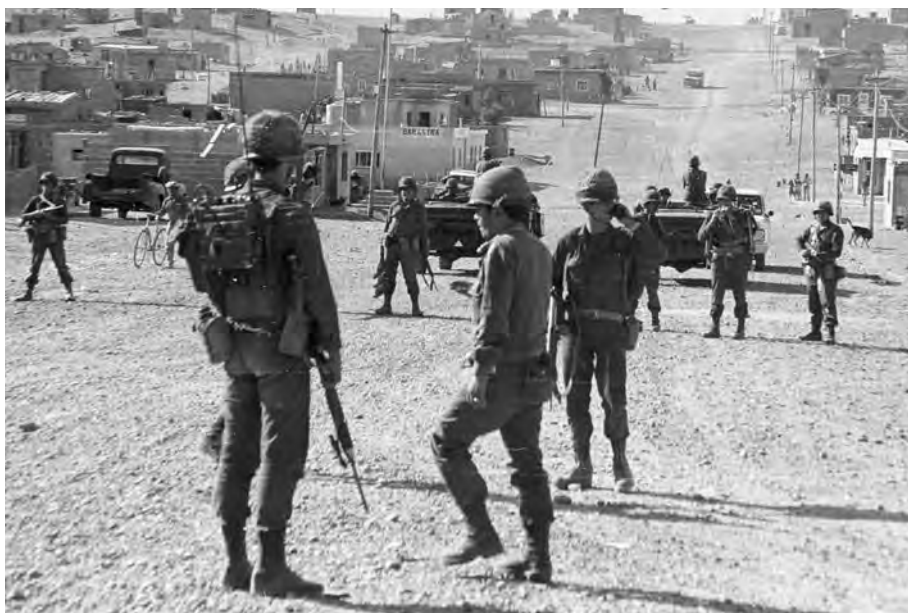
The streets of Barrio Norte of Trelew, Chubut, taken by one of the operations that made the Army