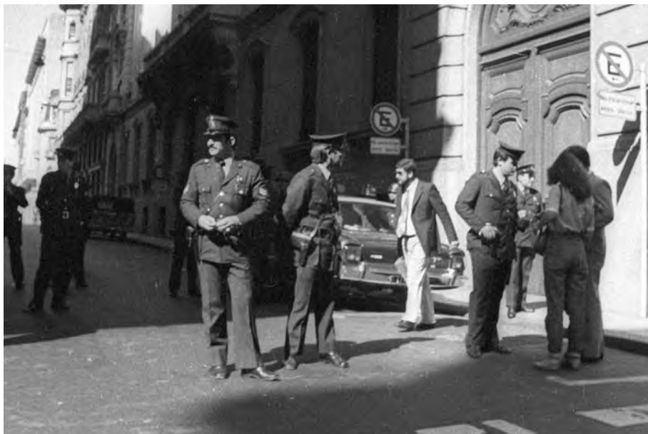
During the civil-military dictatorship, the Federal Police participated in detentions and was part of the repressive state apparatus