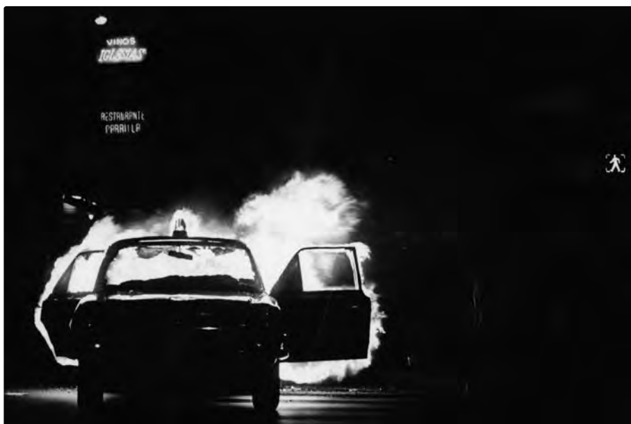
After the coup of March 1976 violence was installed in the streets of major cities in the country