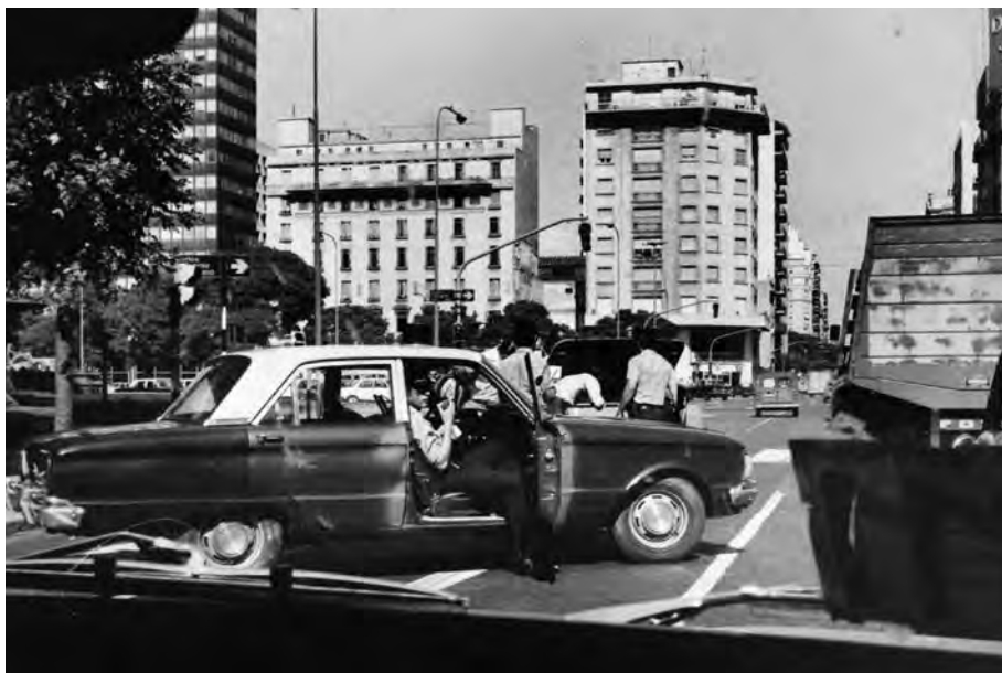
Police procedure in the heart of the city of Buenos Aires