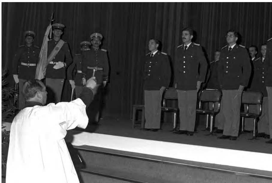
Some sectors of the Catholic Church had strong links with the leaders of the civil-military dictatorship