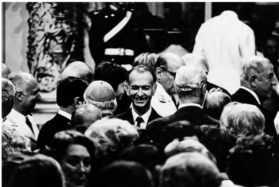
Martínez de Hoz (center), first Economy Minister of the civil-military dictatorship